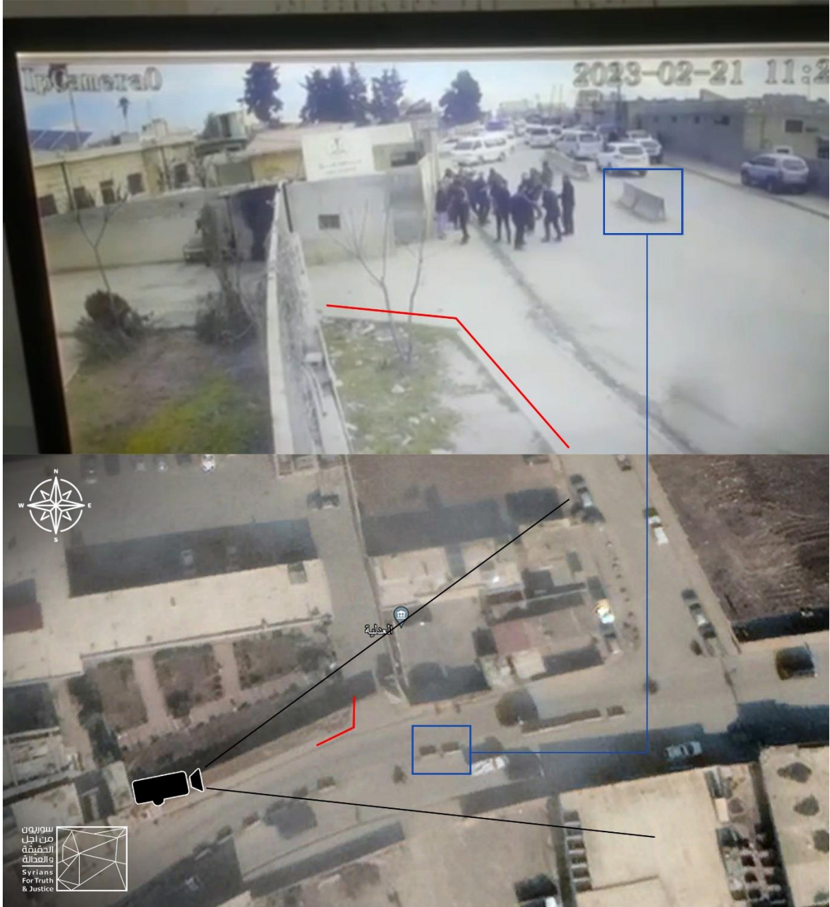
ربط صورة مأخوذة من كاميرا مخصصة للمراقبة مع صورة أقمار اصطناعية.