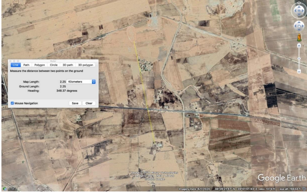
صورة رقم (1) تظهر موقع منزل عائلة "عيسى" والمسافة بينه وبين موقع تمرکز القوات التركية (الخط الأصفر).

كما قام بتحليل مقطع فيديو نشرته وكالة "نورث برس" و مقطع آخر نشرته وكالة "هوار" المقربة من الإدارة الذاتية.