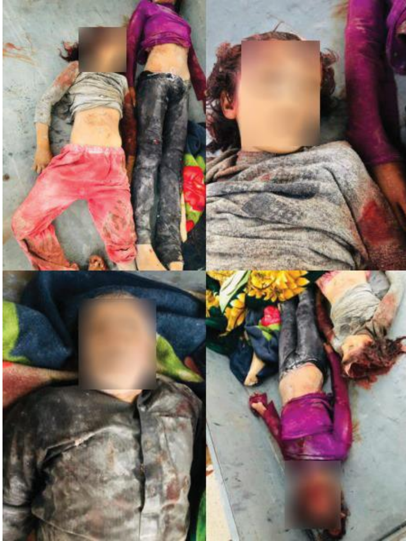
صورة رقم (7) - صور ضحايا الهجوم.