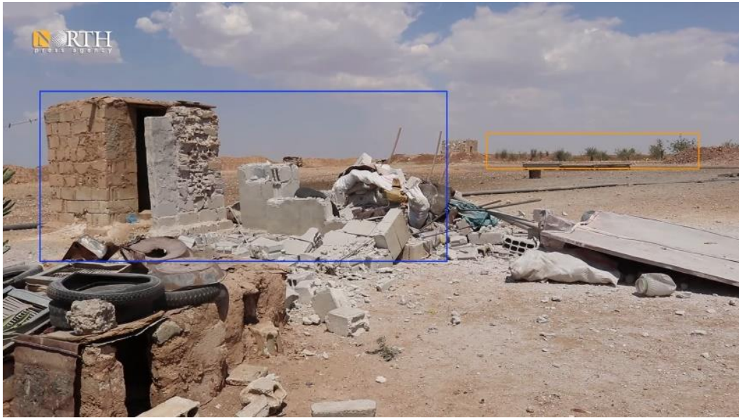
صورة رقم (2) - صورة مأخوذة من مقطع فيديو نشرته وكالة "نورث برس"، يُظهر الضرر الذي لحق بمنزل "عيسى".