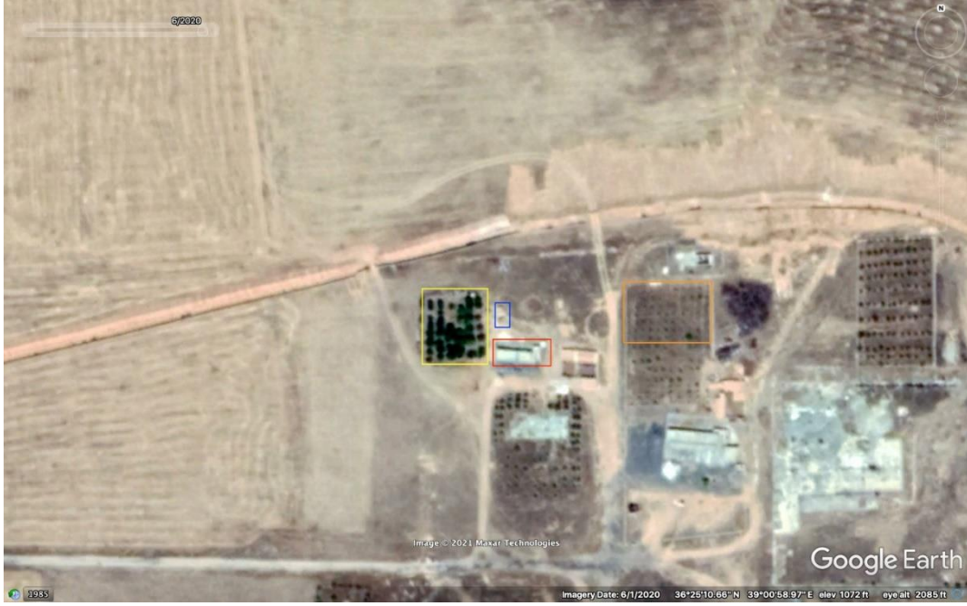
صورة رقم (3) - ربط صورة الأقمار الاصطناعية بصور حية.