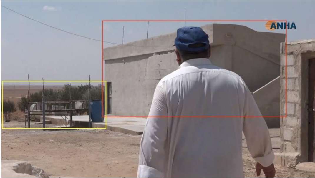
صورة رقم (4) - صورة مأخوذة من مقطع فيديو نشرته وكالة هاوار - ANHA يُظهر أحد المواقع القريبة من المنزل المستهدف.

أيضاً قام خير التحقق الرقمي بالتحقق من الرواية القائلة أن الصور المتداولة لضحايا القصف هي صور لقصف سابق وقع في عام 2016، وخلص إلى أن صور الأطفال الضحايا هي صور جديدة لم يسبق نشرها، وأن الصورة المتداولة هي عبارة عن صورة لعملية بحث غير مكتملة، وقام بشرح الحالة على الشكل التالي: