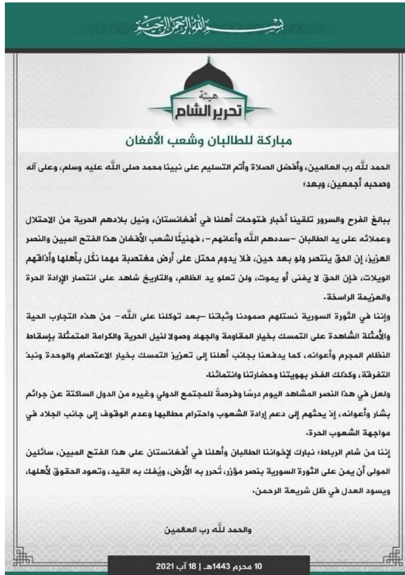
Image 4- Copy of the HTS statement of congratulation, praising Taliban for their control over Kabul. The statement was published on 18 August 2021.

In the statement, HTS also said that they “in the Syrian revolution, derive their steadfastness and constancy from such living experiences.”