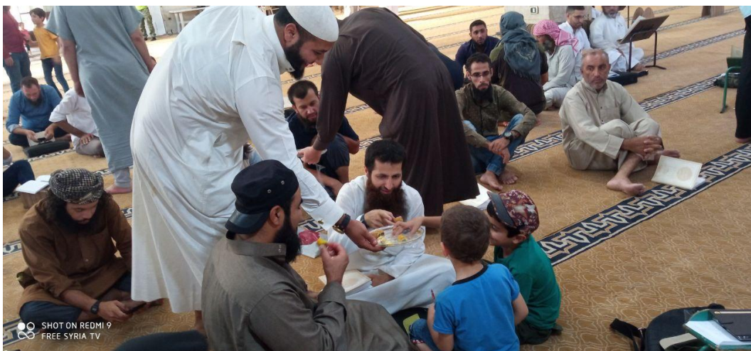
Image 1 – Sweets distributed in an Idlib-based mosque, celebrating Taliban's control over Kabul.

Over the next few days, other forms of celebrations were held on the city's streets. HTS fighters distributed sweets and vehicles displaying the HTS flag and playing takbir or shouting slogans rejoicing the “Taliban's victory” as they paraded throughout the city.