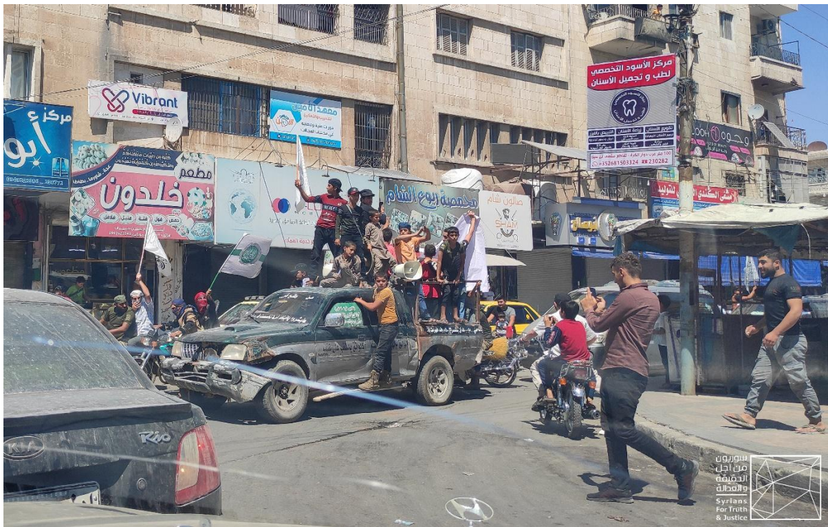
Image 5- A group of people, including children, from one of the HTS-held rallies in Idlib province, celebrating what the HTS described as “Taliban’s victory” in Afghanistan.

Notably, a large segment of Idlib's population renounced the celebrations and the directives of the HTS and the SSG.