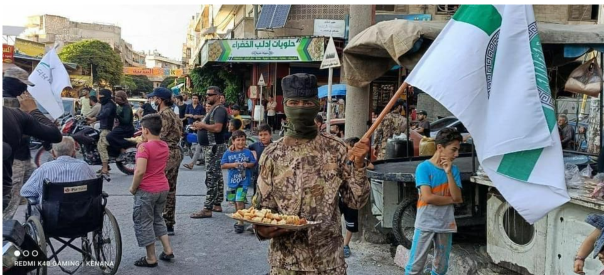
Image 3- HTS fighter distributing sweets, celebrating Taliban's control of Kabul.