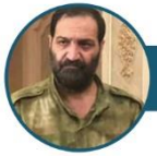
النائب الثاني لرئيس هيئة الأركان العقيد فضل الله الحجّي