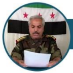
النائب الأول لرئيس هيئة الأركان العميد عدنان الأحمد