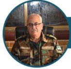
وزير الدفاع رئيس هيئة الأركان اللواء سليم إدريس