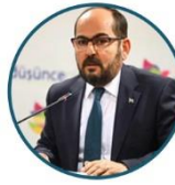
رئيس الحكومة السورية المؤقتة عبد الرحمن مصطفى