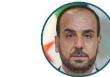
رئيس الائتلاف نصر موسى الحريري