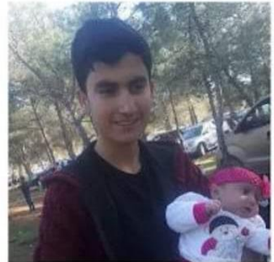
صورة رقم (1) - صورة لأفراد عائلة "ايبو" المعتقلين لدى "مجلس منبج العسكري"