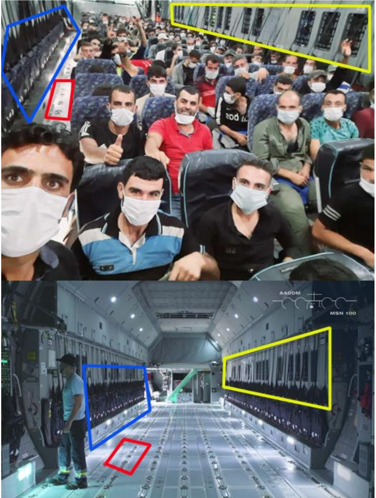
صورة رقم (2). صورة تظهر الصورة في الأسفل هيكل طائرة عسكرية نوع A400M من الداخل، وهي تتطابق مع هيكل الطائرة في الصورة العلوية التي تم نشرها.