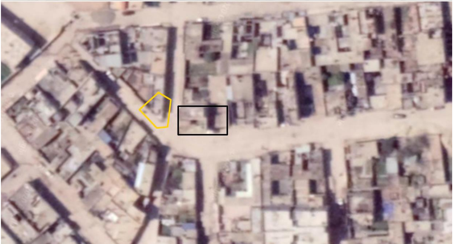
صورة رقم (4). تحليل الأدلة البصرية.