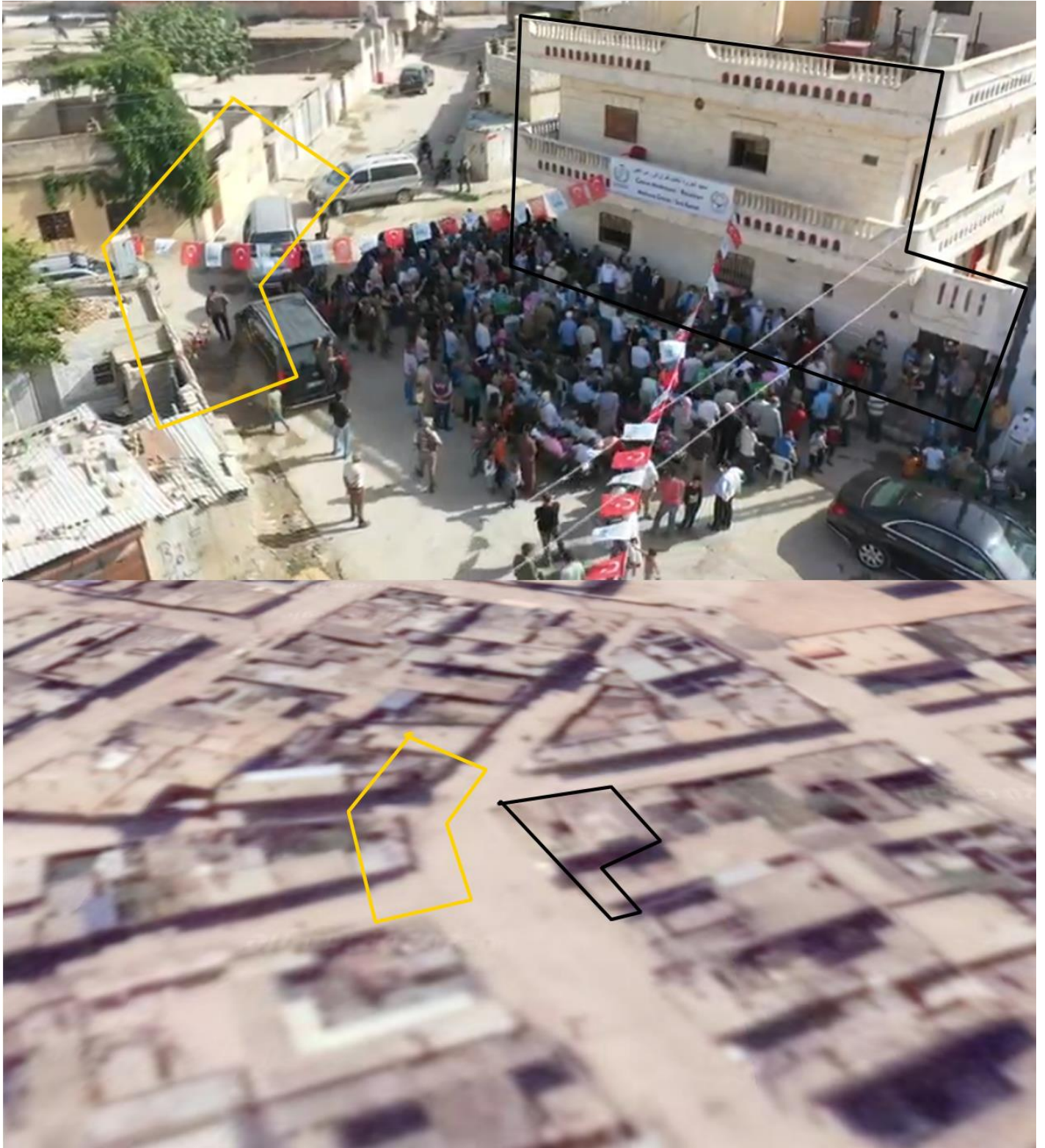
صورة رقم (3). تحليل الأدلة البصرية.