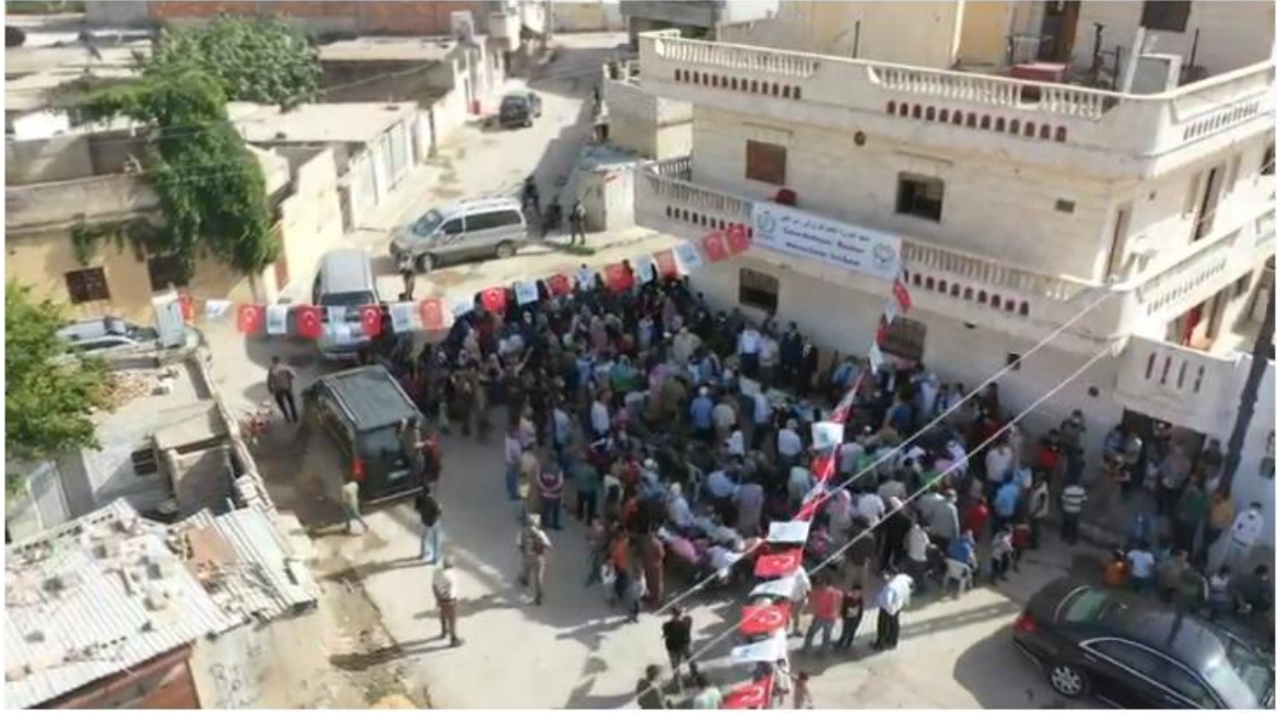
صورة رقم (1).