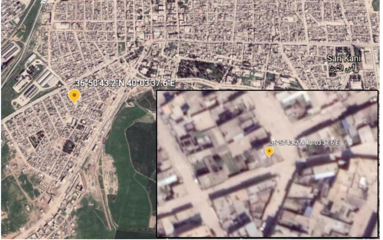
صورة رقم (5). موقع المنزلين في مدينة رأس العين/سري كانيه.