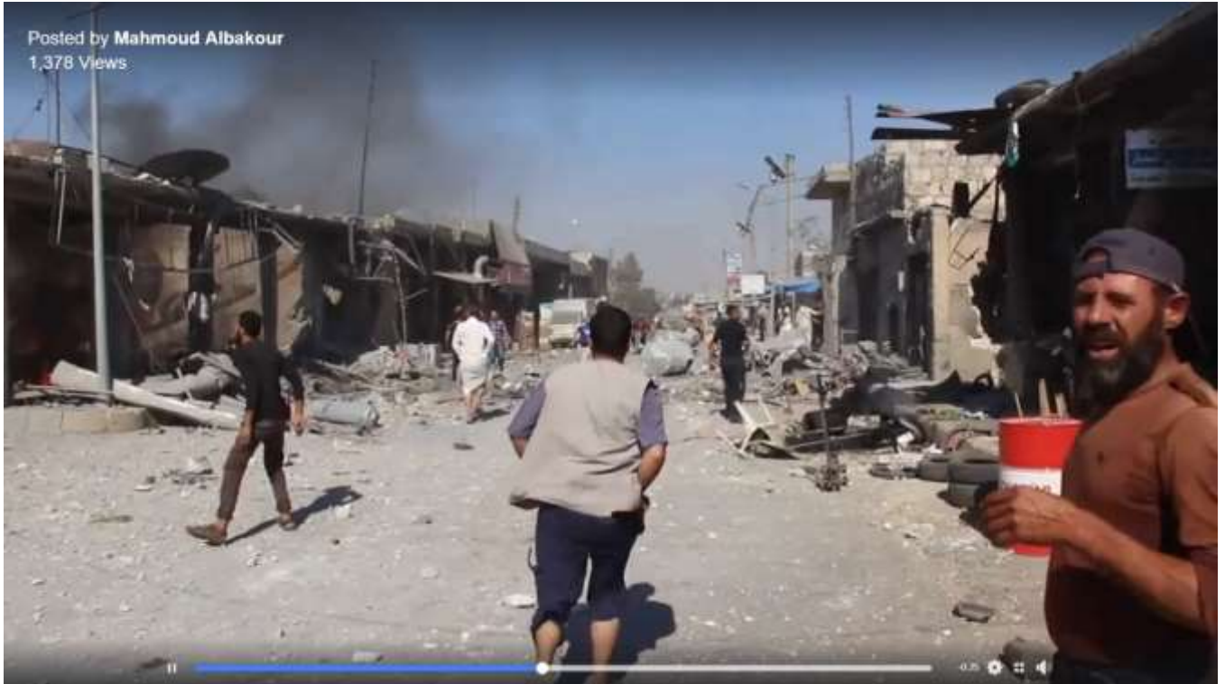
صورة مأخوذة من مقطع الفيديو السابق، تبين آثار القصف الذي طال مدينة سراقب بتاريخ 22 تموز/يوليو 2019.

وأظهر مقطع فيديو 8 لأحد الناشطين الإعلاميين في مدينة سراقب حجم الدمار الذي لحق بالمدينة عقب القصف عليها بتاريخ 22 تموز/يوليو 2019.