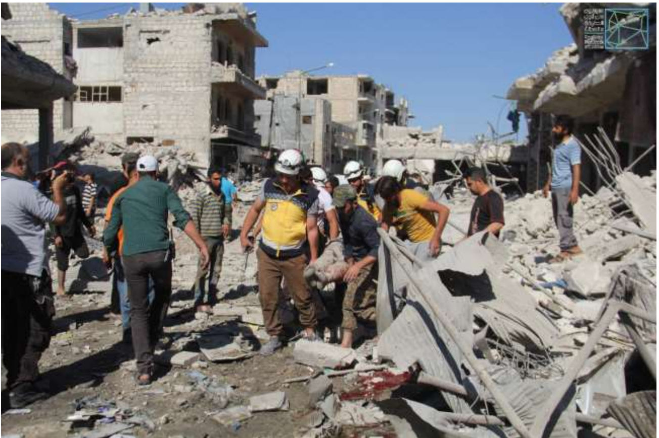
صور خاصة بسوريون من أجل الحقيقة والعدالة، تظهر جانباً من الدمار الذي لحق بمدينة معرة النعمان، عقب القصف الذي تعرضت له بتاريخ 22 تموز/يوليو 2019.