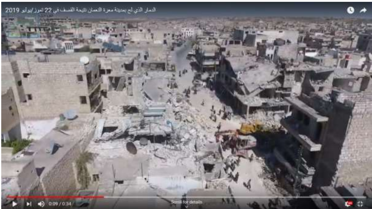
صورة مأخوذة من مقطع السابق، تظهر آثار القصف على مدينة معرة النعمان بتاريخ 22 تموز/يوليو 2019.

وأظهر مقطع فيديو خاص بسوريون من أجل الحقيقة والعدالة، جانباً من الدمار الذي لحق السوق الشعبي بمدينة معرة النعمان جراء القصف الذي طاله بتاريخ 22 تموز/يوليو 2019.