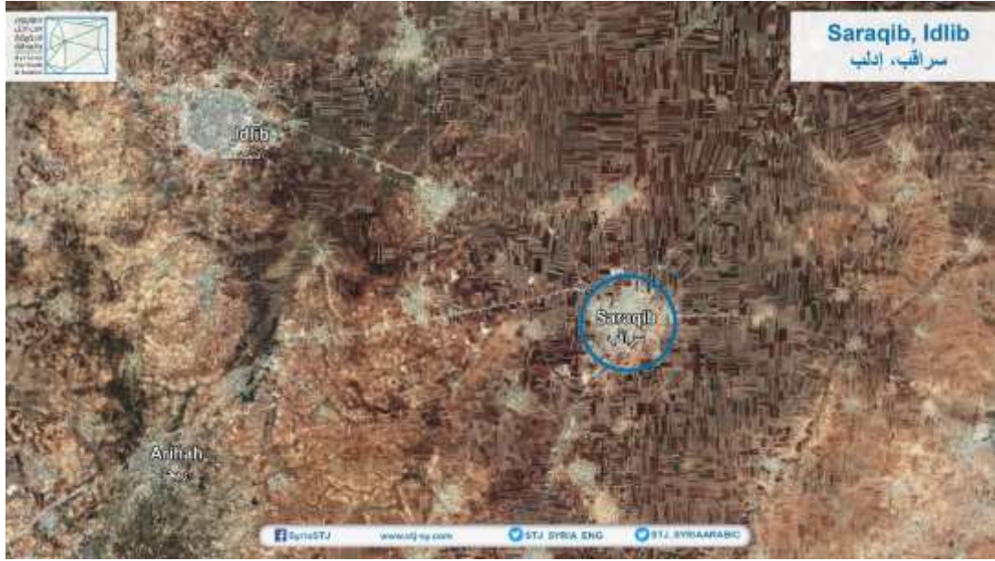
صورة مأخوذة بواسطة القمر الصناعي تبين موقع مدينة سراقب.