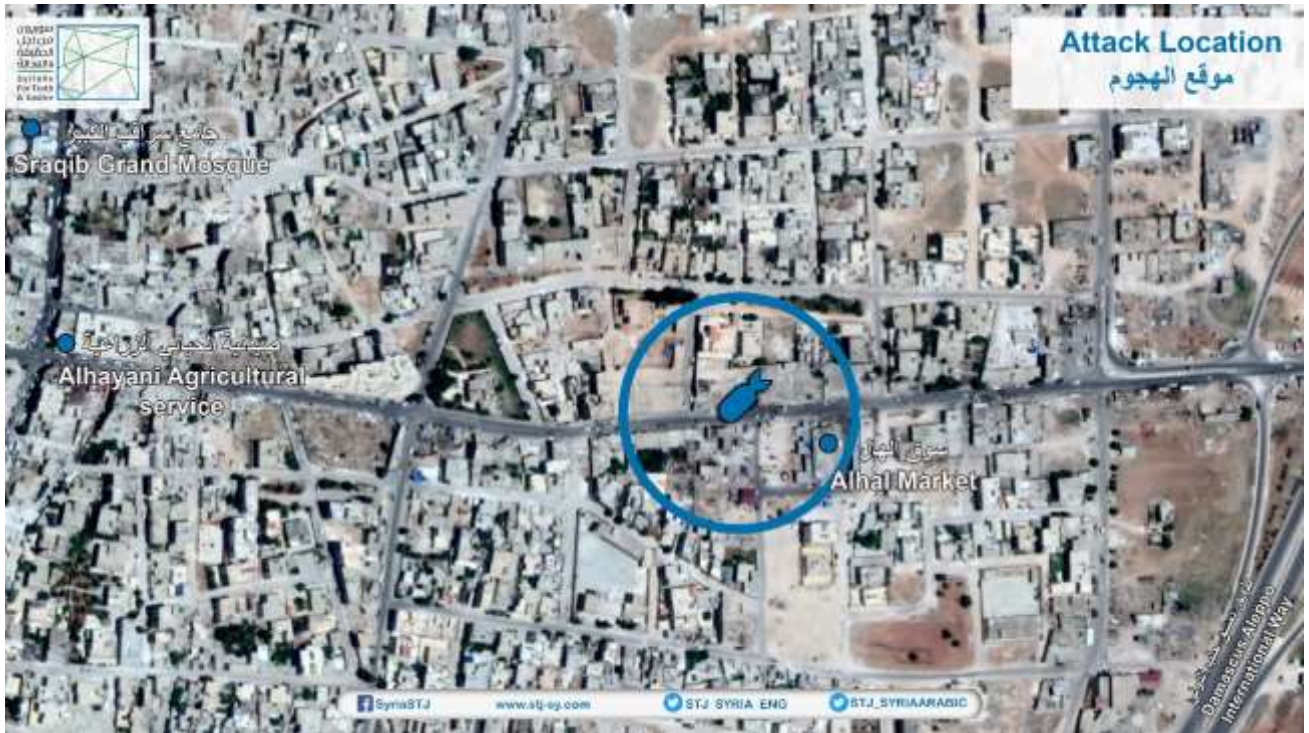
موقع هجوم سراقب.