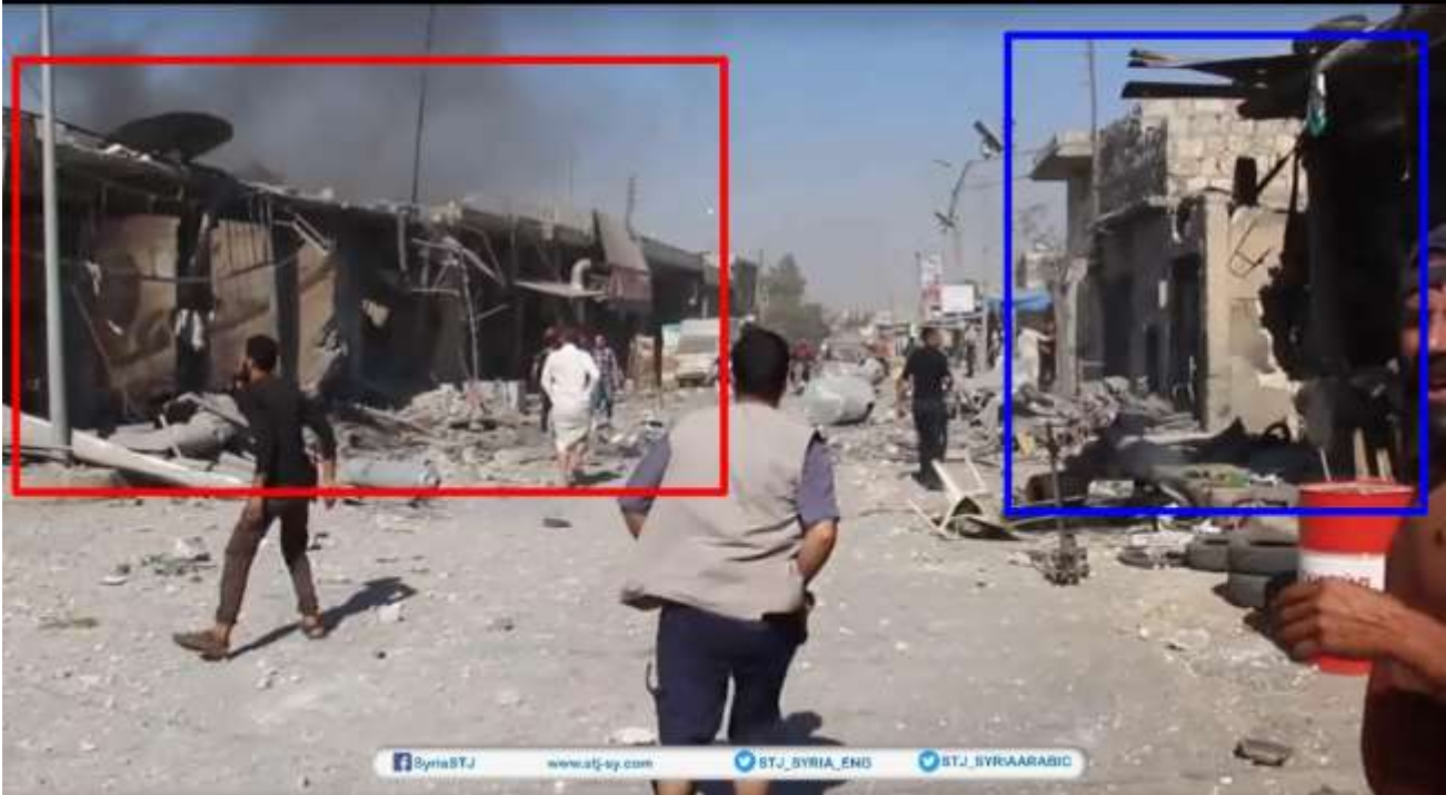
تحليل الأدلة البصرية