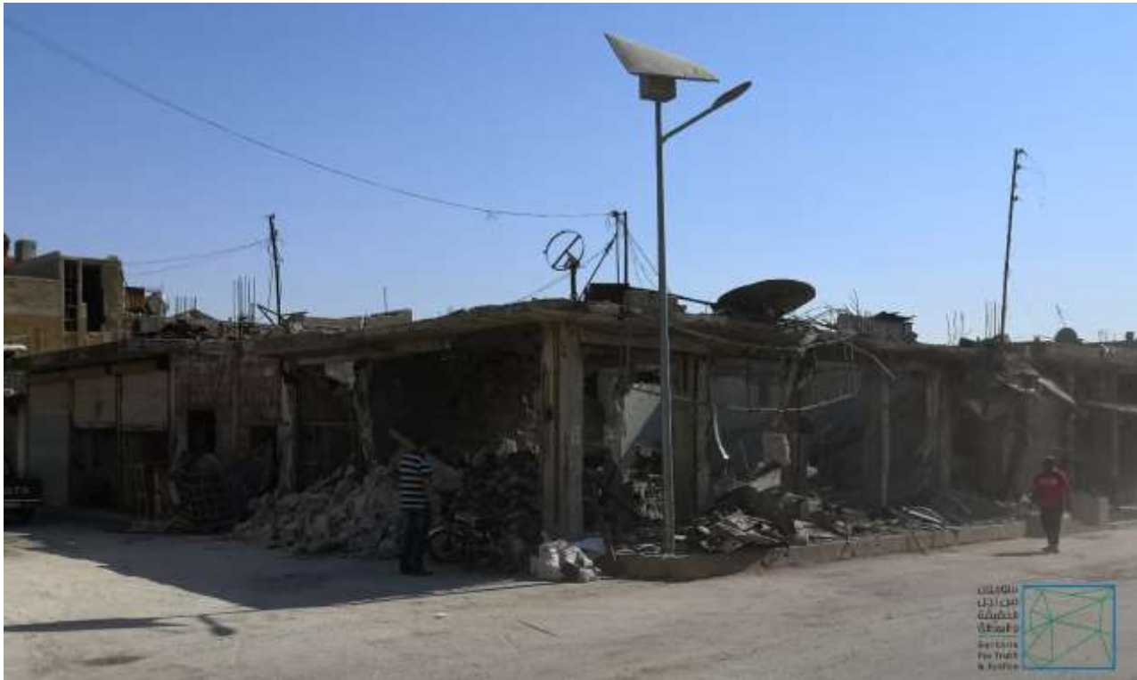
تظهر جانباً من الدمار الذي لحق بمدينة سراقب، عقب القصف الذي تعرضت له بتاريخ 22 تموز/يوليو 2019.