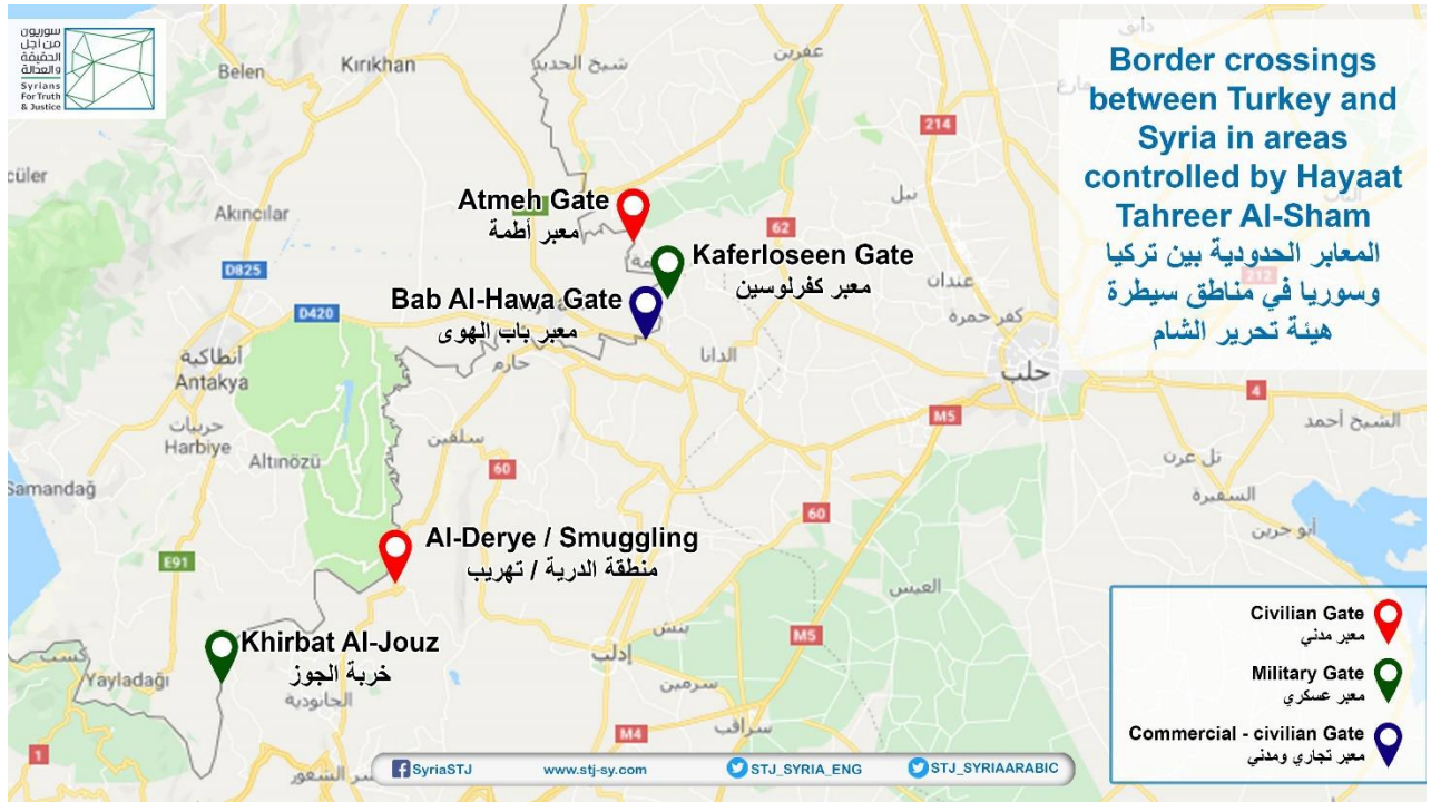
خارطة توضح موقع المعابر الحدودية مع تركيا