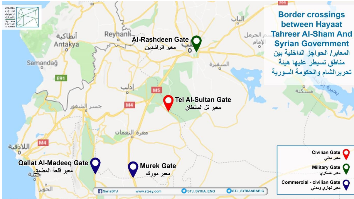
خارطة توضح موقع الحواجز بين هيئة تحرير الشام والقوات النظامية السورية