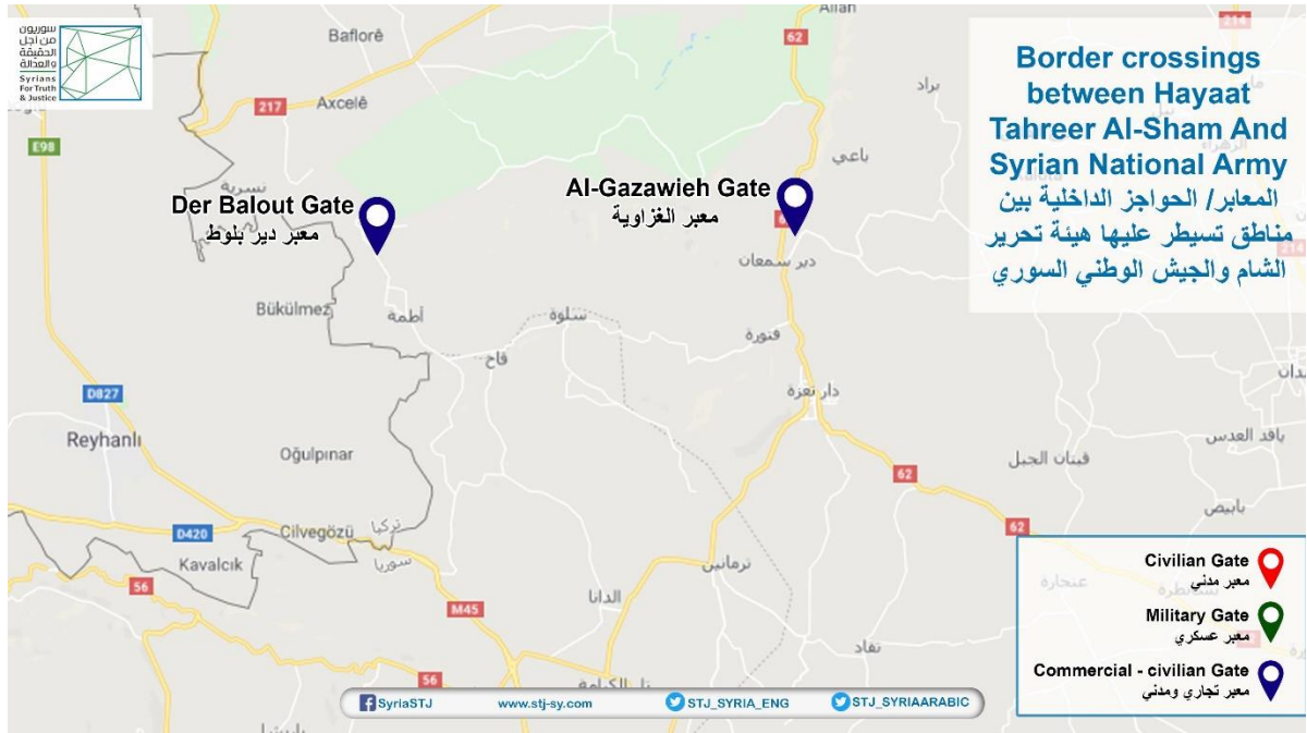
خارطة توضح موقع الحواجز بين هيئة تحرير الشام والجيش الوطني السوري/الإئتلاف السوري المعارض.