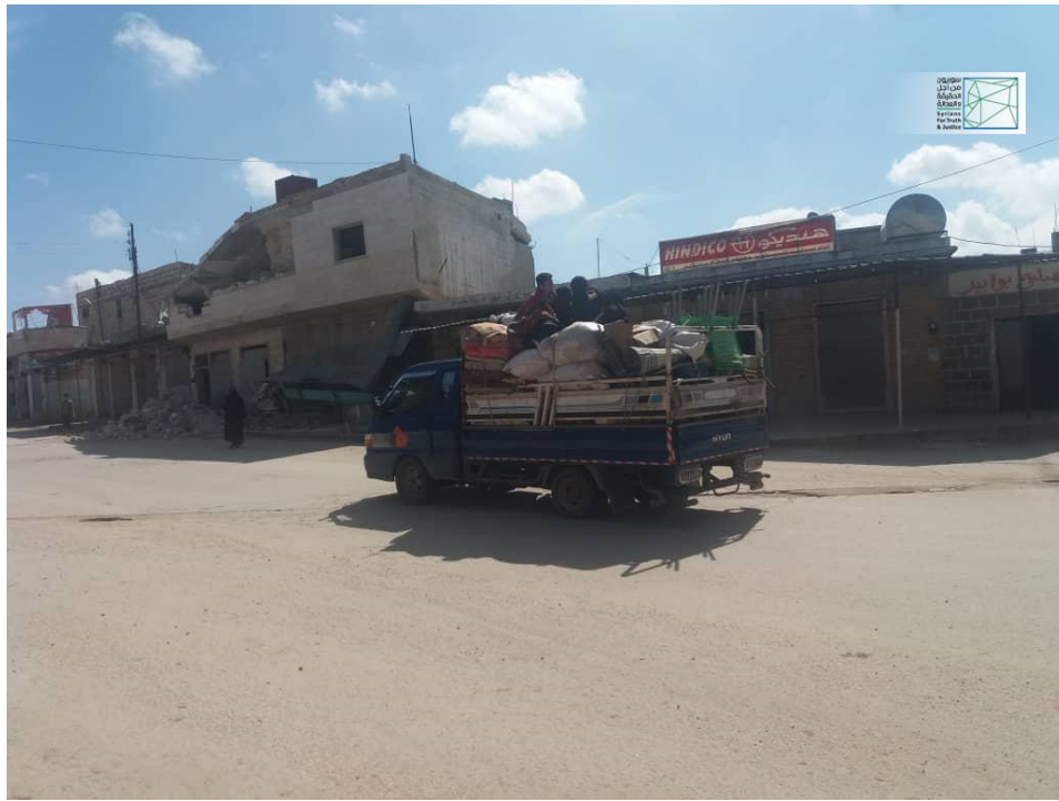
صورة خاصة بسوريون من أجل الحقيقة والعدالة تظهر حركة النزوح في بلدة جرجناز بإدلب.

وبحسب "السلوم" فإن بلدة جرجناز تضم حوالي 24 ألف نسمة أي ما يقارب 3800 عائلة من السكان الأصليين، إضافة إلى نحو 1150 عائلة نازحة من الغوطة الشرقية وحمص وحمه وسنجار.