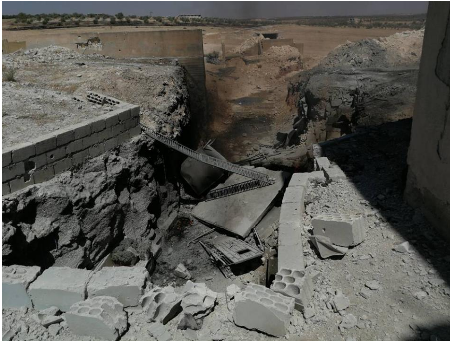
صورة تظهر جانباً من الدمار الذي لحق بمركز الدفاع المدني في بلدة التمانعة، إثر تعرّضه لقصف جوي من قبل سلاح الجو السوري وذلك بتاريخ 6 أيلول/سبتمبر 2018، مصدر الصورة: الدفاع المدني في محافظة إدلب .