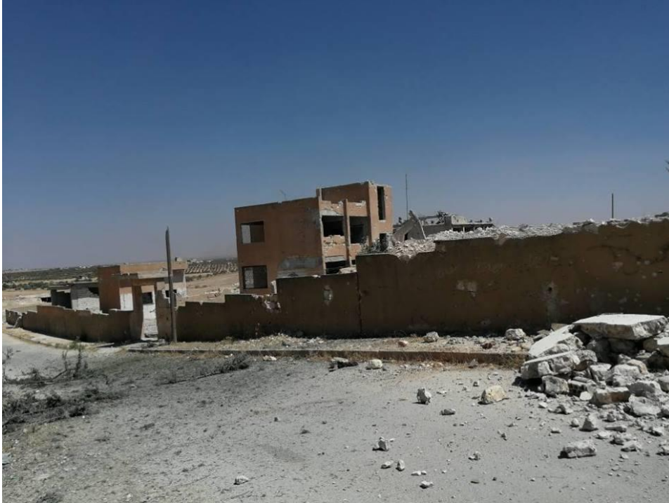
صورة تظهر جانباً من الدمار الذي لحق بأحد المدارس الابتدائية في بلدة التمانعة في ريف ادلب، إثر تعرّضها لقصف جوي من قبل سلاح الجو السوري، وذلك بتاريخ 6 أيلول/سبتمبر 2018، مصدر الصورة: الدفاع المدني في محافظة إدلب .