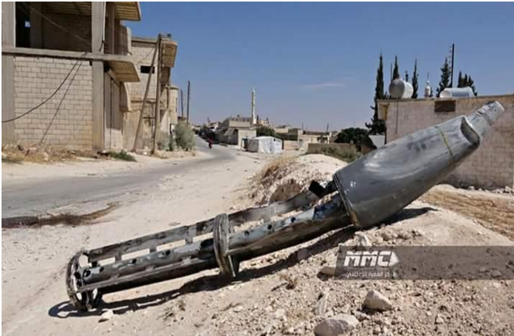
صورة تظهر بقايا إحدى الصواريخ التي تمّ قصف بلدة التح بها، وكانت محمّلة بذخائر عنقودية، وذلك بتاريخ 6 أيلول/سبتمبر 2018.

"تسبّب هذا القصف في مقتل شخص وإصابة طفل، فضلاً عن إصابات أخرى، وقد أدى القصف إلى نزوح معظم سكان البلدة إلى البساتين الزراعية المجاورة للبلدة، خوفاً من استمرا القصف على البلدة، كما سادت حالة رعب كبيرة بين الأهالي بسبب هذا النوع من القصف والذي خلف دماراً أيضاً بمنازل الأهالي، حيث وثقنا سقوط خمسة محمّلة بذخائر عنقودية، توزعت على جميع أنحاء البلدة، وتعدّ هذه الذخائر من أخطر الأسلحة إضافة إلى أنها تتسبّب بإصابات خطيرة يتعرض لها المصابين، وقد تؤدي في بعض الأحيان لعمليات بتر أو مقتل المصاب، وعلى الفور عملت فرق الدفاع المدني والإسعاف على إنقاذ المصابين ونقلهم إلى النقاط الطبية في المشفى، كما بدأ فريق إزالة مخلفات القصف بعملية البحث عن القنابل العنقودية التي انتشرت في البلدة، كما قامت بإعطاء التعليمات لمن تبقى من المدنيين بعدم الاقتراب من الأجسام الغريبة، وإخبار الجهات المختصة لإزالة هذه القنابل من البلدة بشكل كامل، ونتمنى ألا تستمر عملية القصف هذه على البلدة لأن معظم سكان البلدة ليس لديهم القدرة على الانتقال خارج البلدة، وهذا ما سيتسبب بأزمة إنسانية كبيرة قد تصيب العوائل والأطفال والنساء."