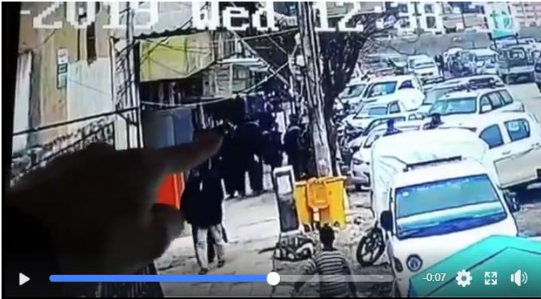
لقطة مأخوذة من مقطع مصور من كاميرا مراقبة تظهر موقع وتاريخ الانفجار الذي ضرب مدينة منبج بمحافظة حلب يوم 16 كانون الثاني/يناير 2019.

وقع التفجير (الذي لم يتم تحديد سببه حتى تاريخ إعداد هذا الخبر) ظهيرة يوم 16 كانون الثاني/يناير 2019، حيث أظهر تسجيل مصور مأخوذ من كاميرا مراقبة في الشارع لحظة وقوع الانفجار الذي وقع عند باب مطعم "الأمرء" أثناء تواجد عناصر من التحالف الدولي وآخرين من "مجلس منبج العسكري" مع عدد من المدنيين داخل المطعم، ما تسبب بمقتل 4 جنود من الجنسية الأمريكية وجنديان يتبعان لـ"مجلس منبج العسكري" وسبعة مدنيين، إضافة إلى إصابة أربعة جنود من التحالف الدولي واثنين آخرين من "مجلس منبج العسكري" و13 مدنياً، وذلك في آخر حصيلة لضحايا التفجير حسب ما نقلت وكالة أنباء محلية عن مصدر طبي في مدينة منبج. 1