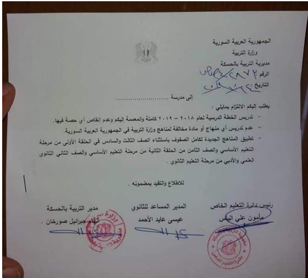
صورة تظهر القرار الصادر عن مديرية التربية في الحسكة بتاريخ 14 تشرين الأول/أكتوبر 2018، مصدر الصورة: ناشطون من الحسكة.

ومن الجدير ذكره إلى أنّ الإدارة الذاتية كان قد عمدت إلى إغلاق العديد من المدارس الخاصة التابعة للكنائس المسيحية بما فيها مدارس سريانية وأرمنية، وذلك خلال شهر آب/أغسطس 2018، وذلك بسبب عدم ترخيصها من قبل الإدارة الذاتية وقيامها بتدريس منهاج لا توافق عليه الإدارة الذاتية (منهاج الحكومة السورية)، حيث كانت سوريون من أجل الحقيقة والعدالة قد أعدت تقريراً حول هذا الموضوع. 1