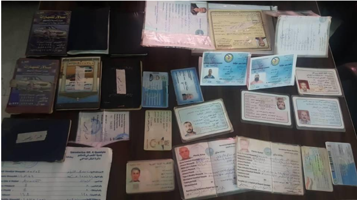
صورة تظهر جانباً من رخص القيادة التي تمّت مصادرتها لمخالفتها قرار منع نقل الطلاب إلى مدارس الحكومة السورية في مدينة القامشلي/قامشلو،