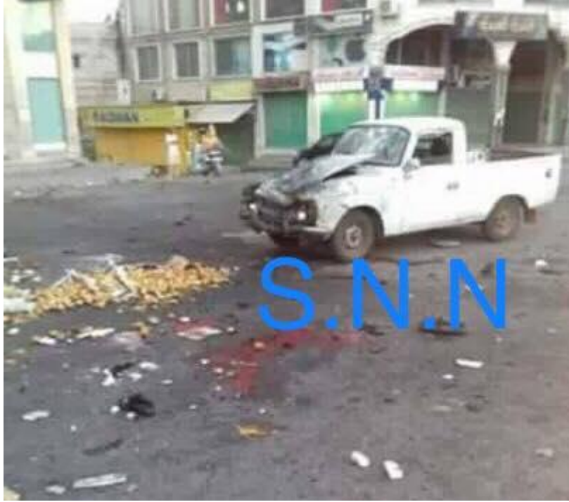
صورة نشرتها "شبكة أخبار السويداء" يوم 25 تموز/يوليو 2018، تظهر آثار دماء وسيارة متضررة بعد تفجير استهدف سوق الخضار في مدينة السويداء.

بدورها، بثت "شبكة أخبار السويداء" مقطعاً مصوراً يظهر فيه رجلاً مشنوقاً مع تجمع كبير للناس، حيث قالت الشبكة أن الرجل المشنوق هو عنصر انتحاري يتبع لـ"تنظيم الدولة" حاول تفجير نفسه بحزام ناسف أمام مشفى السويداء الوطني. ولم تستطع سوريون من أجل الحقيقة والعدالة التحقق من هوية الشخص بعد.