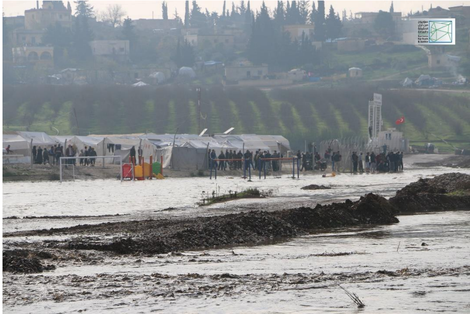
صورة خاصة بسوريون من أجل الحقيقة والعدالة تظهر غرق ملعب الأطفال في مخيم دير بلوط بمنطقة عفرين بعد فيضان النهر يوم 20 كانون الأول/ديسمبر 2018.