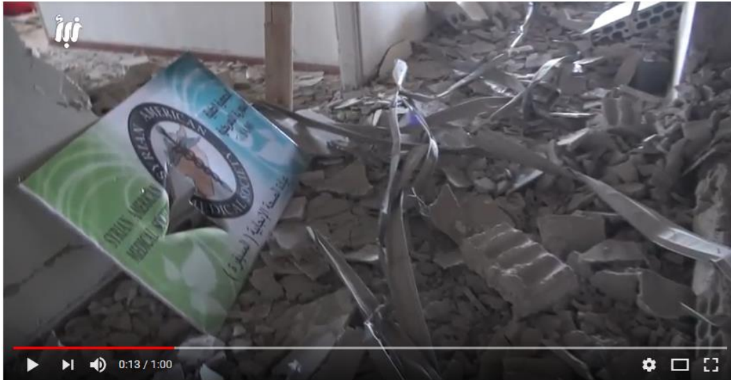
الطائرات الروسية تقصف مشافي درعا وتخرجها عن الخدمة

وكان المشفى الميداني في مدينة الحراك ومركز الدفاع المدني قد تعرضا لقصف جوي من طائرات حربية يعتقد أنها روسية يوم 24 حزيران/يونيو 2018، سببت دمارهما بشكل كامل، كما تعرضت المشافي في الجيزة وصيدا وبصر الحرير والمسيفرة في الـ27 من الشهر ذاته لغارات مماثلة، حيث نشر الدفاع المدني مقطعاً مصوراً يظهر دمار مركز له في مدينة السيفرة، كما نشرت شبكة نأ الإخبارية مقاطعاً آخراً يظهر الدمار في بعض المشافي.