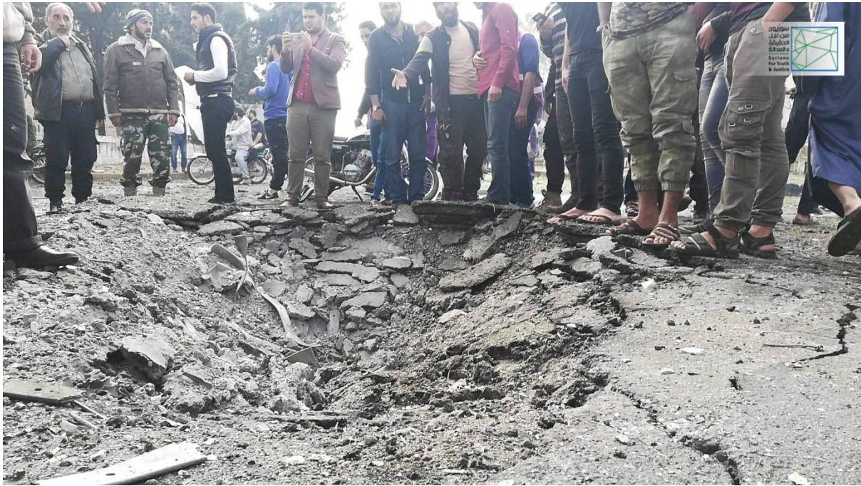
صورة خاصة بسوريون من أجل الحقيقة والعدالة تظهر حفرة أحدثها انفجار سيارة مفخخة في حي القصور بمدينة إدلب يوم 21 تشرين الأول/أكتوبر 2018.