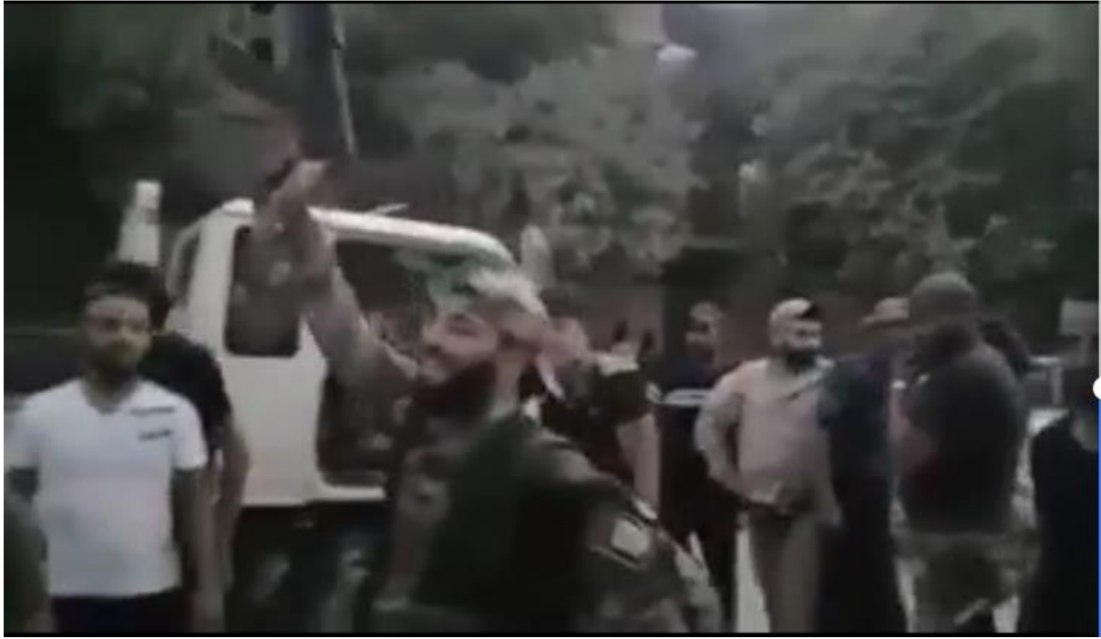
صورة مأخوذة من مقطع مصور يظهر عدداً من الشبان في بلدة يلبدا بعد انضمامهم للفرقة الرابعة.

كذلك انتشرت مقاطع مصورة تم التقاطها في بلدة يلبدا خلال شهر آب/أغسطس 2018، تظهر عدداً من أبناء بلدات جنوب دمشق يرتدون الزي العسكري ويحملون أسحلة خفيفة ويهتفون مؤيدين للفرقة الرابعة التي انتسبوا إليها، وقد تجمعوا عند باصات وسيارات، وقال عدد من الشبان الظاهرين في هذه المقاطع إن وجهتهم هي محافظة إدلب ليشاركوا في المعركة هناك.