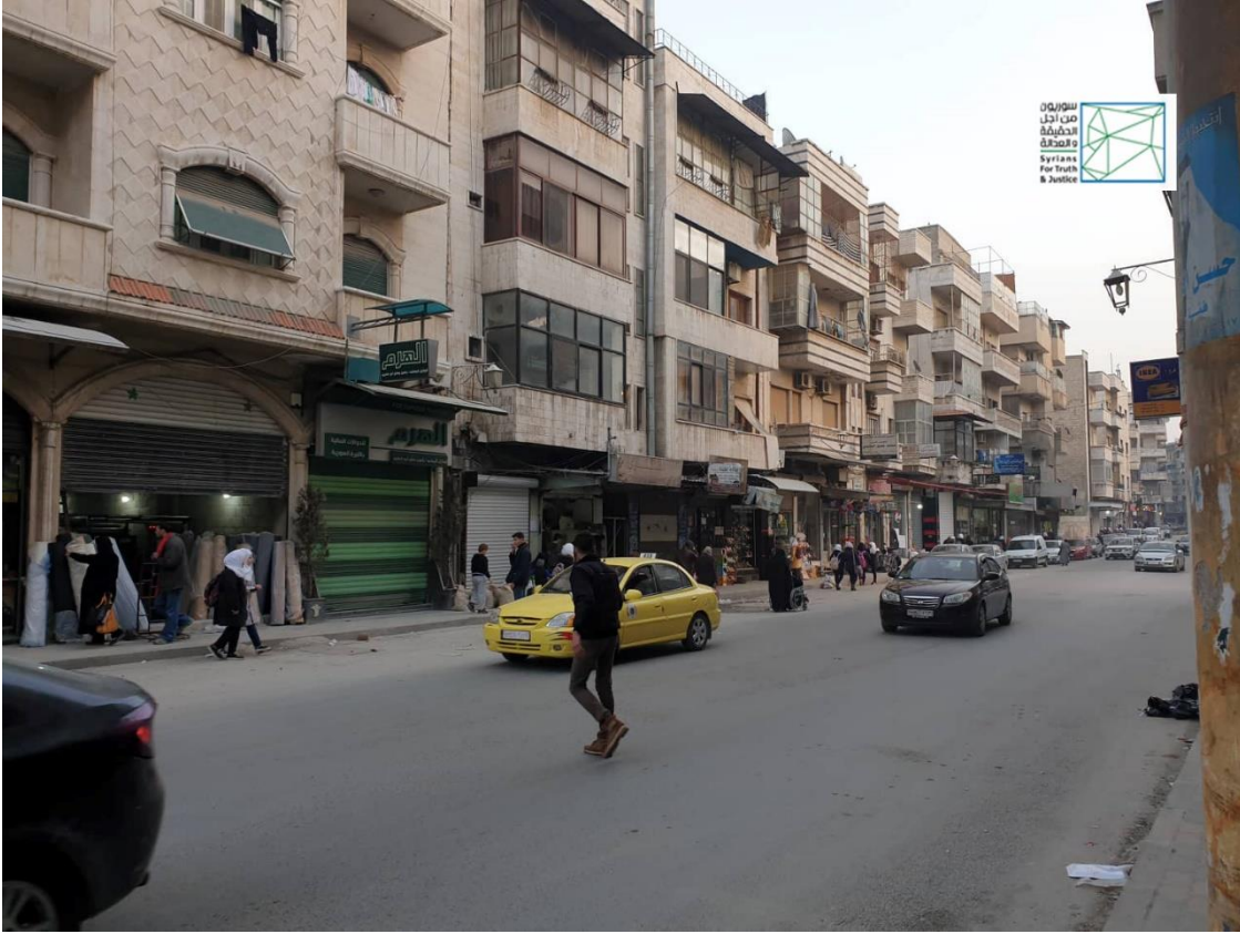
صورة خاصة بسوريون من أجل الحقيقة والعدالة تظهر أحد مكاتب شركة "الهمم" للحوالات المالية في شارع المغيلة بمدينة حماه.