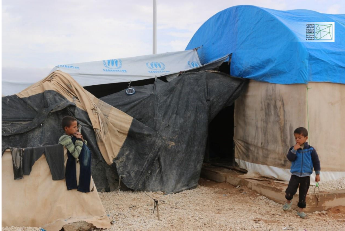
تظهر جانباً من خيم النازحين في مخيم مبروكة، وقد التقطت هذه الصورة في 25 تشرين الأول/أكتوبر 2018.

"نزحنا إلى مخيم بلدة مبروكة بحثاً عن الأمان والاستقرار، لكننا نعاني فيه من نقص الدعم الطبي والأدوية، كما أنّ الخيم التي نقطنها غير صالحة للسكن، ولا سيما خلال فصل الشتاء، بالإضافة إلى عدم توفر المدافئ والعوازل والأغطية، ونقص المواد الغذائية، وكما رأيتم فإنني أقطن مع عائلتي المؤلفة من عشرة أفراد في خيمة صغيرة، لا تقينا حر الصيف ولا برد الشتاء، وأنا مصاب بمرض في العمود الفقري، كما أنّ ابنتي معاقة، لذا نتمنى من المنظمات الدولية والإنسانية النظر إلى حالتنا، وخاصة أنني مستقرّ هنا مع عائلتي بعد أن طال الدمار منزلنا في مدينة البوكمال".