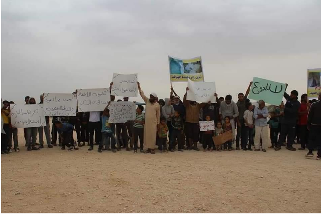
صور للمظاهرة التي نظمت في مخيم مبروكة، في 18 تشرين الأول/أكتوبر 2018، مصدر الصور: هيئة العمل والشؤون الاجتماعية التابعة للإدارة الذاتية .

بتاريخ 18 تشرين الأول/أكتوبر 2018، شهد مخيم مبروكة تظاهرة ضمت مئات النازحين داخلياً، والذين وجهوا نداءً إلى الأمم المتحدة والمنظمات الدولية والإنسانية، مطالبين بإبهم بتحسين الوضع المعيشي والطبي في المخيم. وبحسب الباحث الميداني لدى سوريون من أجل الحقيقة والعدالة، فإن المظاهرة نظمت في إحدى ساحات المخيم، واستمرت نحو ساعتين متواصلتين دون أي تدخل من سلطة المخيم التابعة للإدارة الذاتية، إذ حمل المتظاهرون لافتات تطالب بتوفير الغذاء الكاف والرعاية الطبية، وتحسين الوضع الإنساني في المخيم مع حلول فصل الشتاء.