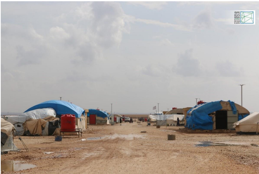
صور خاصة بسوريون من أجل الحقيقة والعدالة، تظهر جوانب مختلفة من مخيم مبروكة، وقد التقطت هذه الصور في 25 تشرين الأول/أكتوبر 2018.