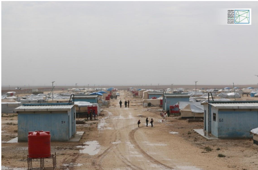
صورة خاصة بسوريون من أجل الحقيقة والعدالة، تظهر جانبا من مخيم مبروكة، وقد التقطت هذه الصورة في 25 تشرين الأول/أكتوبر 2018.

"كانت رحلة نزوحنا إلى مخيم بلدة مبروكة متّخمة بالمعاناة والألم، وقد دفعنا مليوناً ونصف المليون ليرة سورية للمهريين حتى وصلنا إلى هذا المخيم، والذي يعمّه الأمان، ولكن تنقصه الرعاية على جميع الأصعدة، فكافة المواد الغذائية المقدّمة لنا ضمن سلة المساعدات الشهرية، ومنها البازلاء والرز والزيت، سيئة النوعية جداً، ومحال على الأطفال التعامل معها، كما يجد المسنين صعوبة بالغة في هضمها، فضلاً عن سوء تخزينها ضمن المخيم "قبل التوزيع" أيضاً، ولكنّ النازحين مجبرون على أكلها بسبب تدهور وضعهم الاقتصادي، إذ لا يستطيع معظم سكان المخيم تحمّل أعباء المعيشة في ظل ارتفاع أسعار المواد الغذائية، فنحن لا نحصل في المخيم على وجبات فطور أو غداء وعشاء، كما أنّ الخبز الذي يقدمونه لنا غير كافٍ أبداً، على الرغم من أننا أبلغنا إدارة المخيم بذلك مراراً وتكراراً، ولكنهم لم يستجيبوا، بالإضافة إلى ذلك فإنّ الخيام ممزقة وغير صالحة للسكن، فنحن نقطن هذه الخيمة منذ سنة، وسكنت بها قبلنا عائلة أخرى لنحو ثمانية شهور متواصلة".