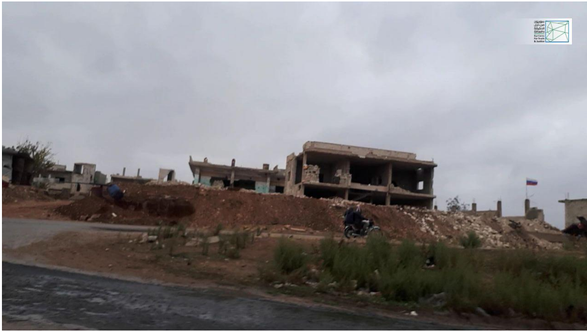
صورة خاصة بسوريون من أجل الحقيقة والعدالة تظهر مقراً عسكرياً للقوات النظامية السورية والقوات الروسية وتُظهر الصورة العلم الروسي مرفوعاً على يمينها، تم التقاط الصورة بتاريخ 4 تشرين الثاني/نوفمبر 2018.

وأضاف الباحث الميداني أن الأجهزة الأمنية والقوات النظامية كانت قد استولت على عدد من الآليات والسيارات عند دخولها مدينة الرستن، وقام عدد من أصحاب هذه الممتلكات بدفع مبالغ مالية لاستعادتها وذلك عبر وسطاء يعملون في الأجهزة الأمنية.