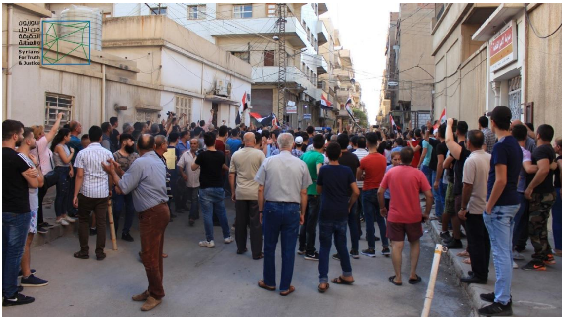
Tens of Syriac peoples staged a protest in front of al-Amal Private School in Qamishli denying the closure decision.