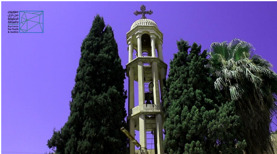
The bell of Mar Assia al-Hakim Church in al-Darbasiyah.

"Classrooms today are of about 60 students each, mostly Kurdish, after they were of only 30 to 35 before the outbreak of the Syrian crisis, as the pope ordered to receive more. People routinely walk-in the church up until now to register their children, but the church is pending on following the closure decision until the archbishop, who is on a visit to the USA, comes back." The witness added.